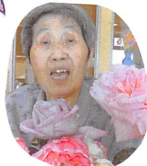
お誕生日おめでとうございます♪