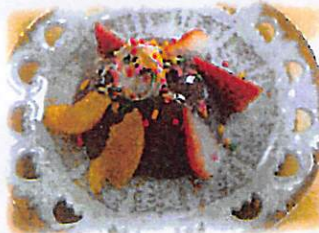
プリンアラモード