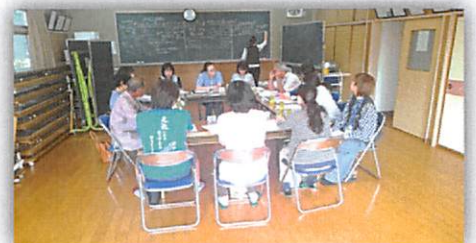
個別地域ケア会議の様子